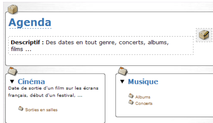
Une hiérarchie de rubriques pour les thèmes

Voilà, les événements sont créés dans une arborescence de rubriques thématiques, sont positionnés à une date, passons aux choses sérieuses :